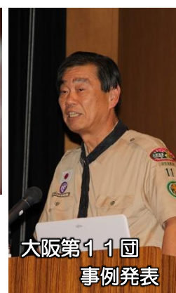
大阪第11団 事例発表