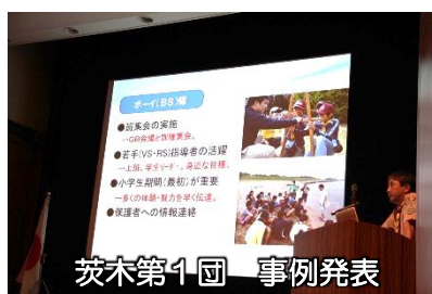
茨木第1団 事例発表