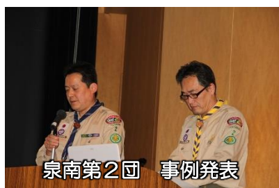
泉南第2団 事例発表