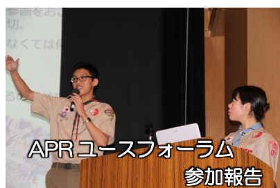
APR ユースフォーラム 参加報告