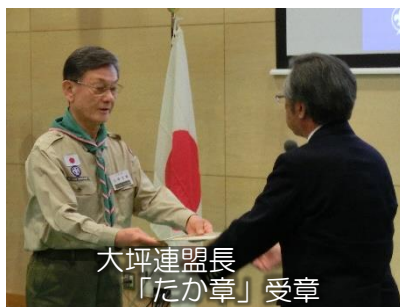
大坪連盟長 「たか章」受章